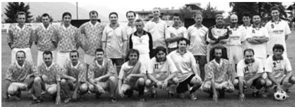
Foto di gruppo per gli amministratori e i dipendenti dei comuni di Baveno, Stresa e Gravellona

In campo la squadra di casa e Stresa e Gravellona